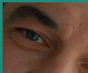
ABB. 5: Seborrhoisches Lid- ekzem. Im Bereich des rechten Oberlids imponiert eine feuchte Schuppung auf Erythem mit Übergreifen der Hautveränderungen auf die zentrale Stirnpartie.