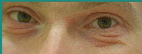
ABB. 4: Atopisches Lid- ekzem: flächige, schuppige Erytheme an beiden Ober- und Unterlidern.