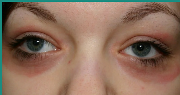
ABB. 1: Ein Augenlidekzem äußert sich durch Rötungen, Schwellungen und oft starken Juckreiz.

bei denen die Hautbarriere oft aufgrund eines Gendefekts gestört ist. Sie – aber auch ältere Menschen mit ihrer häufig sehr trockenen, empfindlichen Haut – leiden deshalb vermehrt unter Augenlidekzemen.