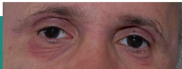
ABB. 3: Atopisches Lid- ekzem: unscharf begrenzte flächige Erytheme an Ober- und Unterlidern.